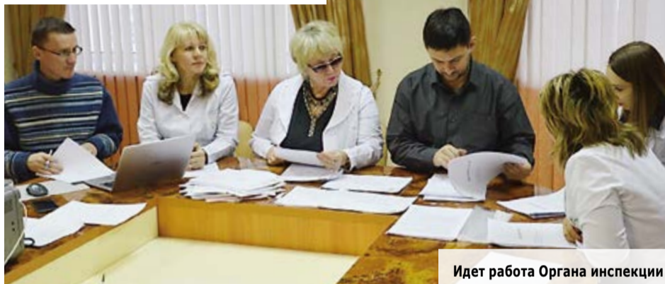
Идет работа Органа инспекции

Штат сотрудников органа инспекции укомплектован, состоит из компетентного персонала, экспертов, имеющих соответствующее образование, профессиональную специальную